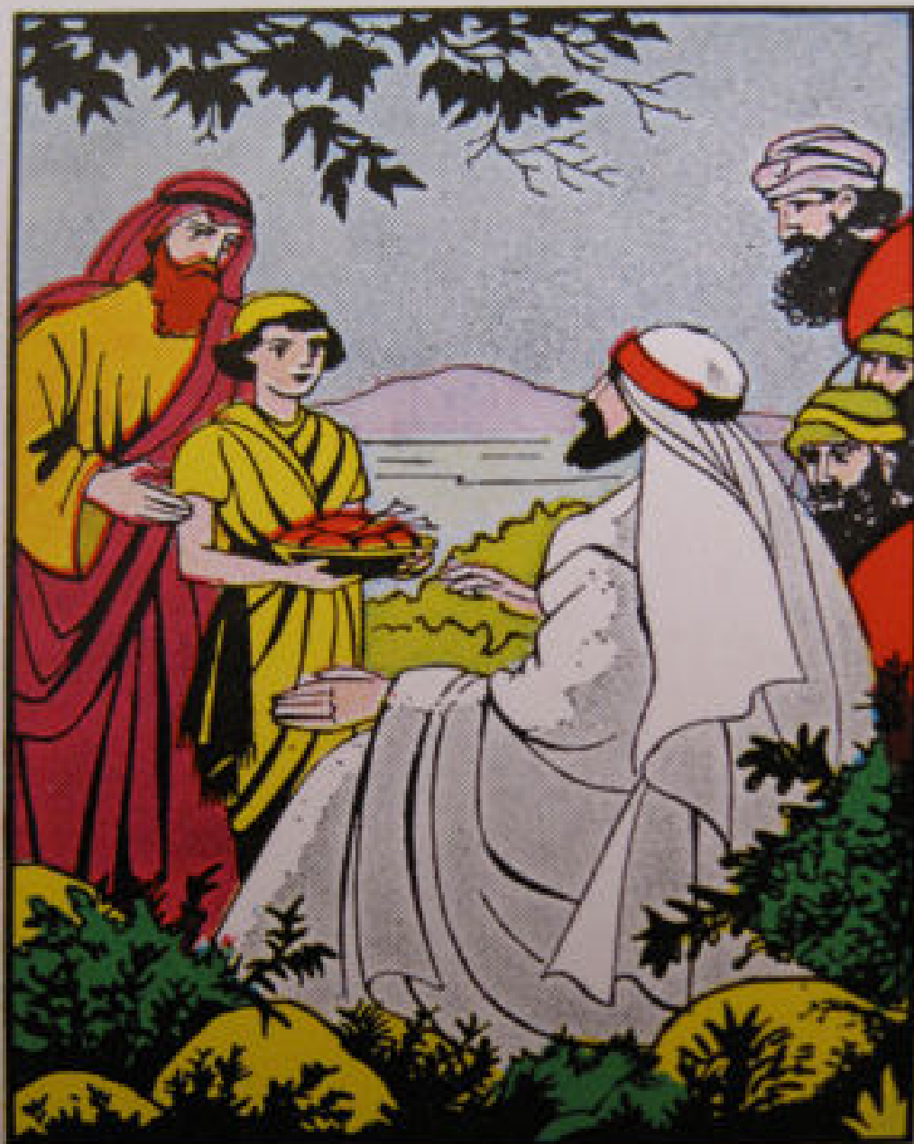
19 Spijziging van de vijfduizend Een jongen brengt vijf broden en twee vissen, waarmee Jezus de menigte spijzigt. Mattheüs 14 : 13—21