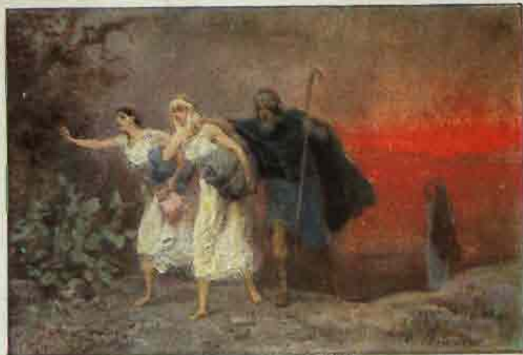
6. De vlucht van Lot uit Sodom