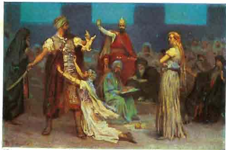
43. Salomo's eerste rechtspraak