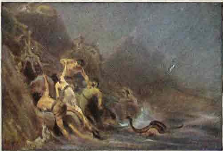
3. De Zondvloed