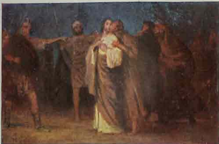
81. Jezus door Judas verraden