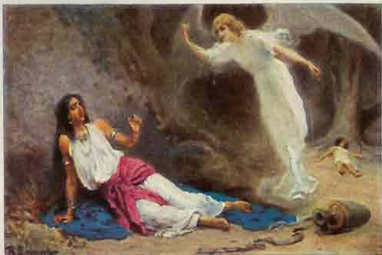
7. Hagar en Ismaël in de woestijn