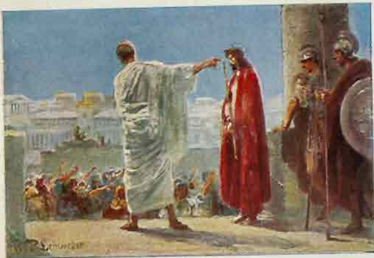
85. Jezus voor Pilatus. „Zie de Mensch!“