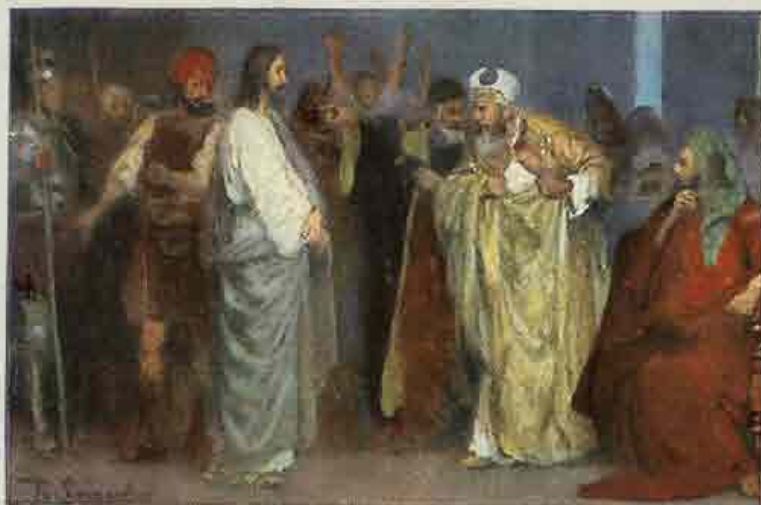
82. Jezus vor Kajafas