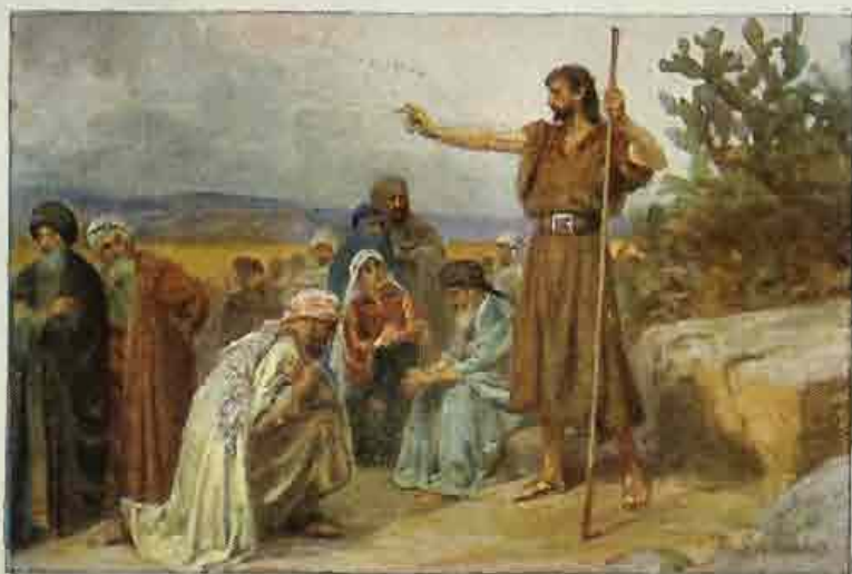
57. De prediking van Johannes den Dooper.