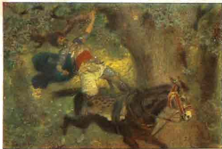
42. Absalom's dood