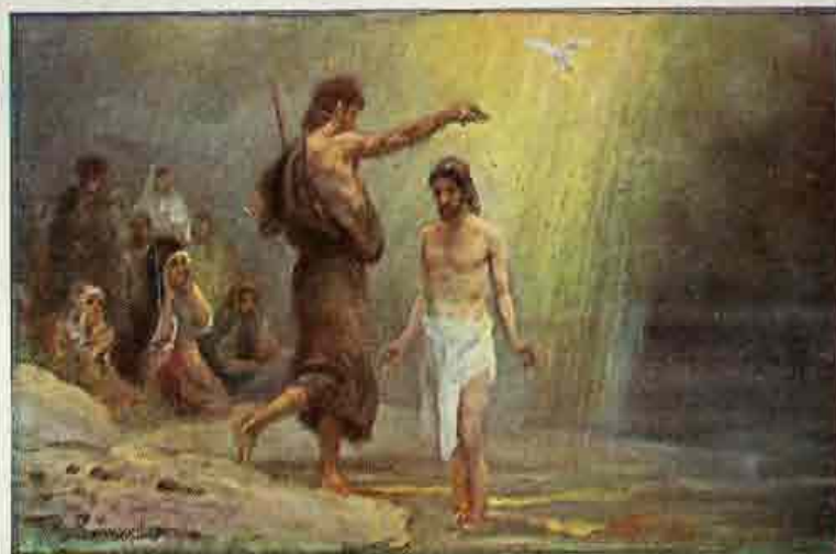
58. Jezus wordt door Johannes gedoopt