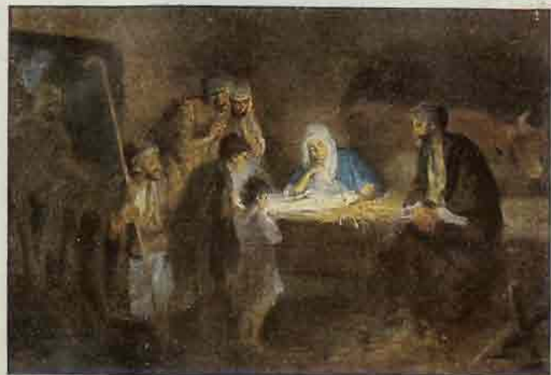
52. De herders bij het Kindeke.