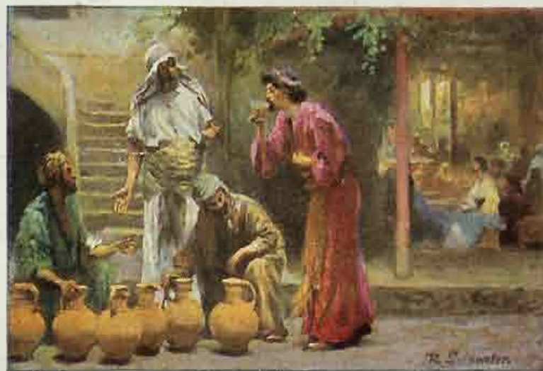
59. De bruiloft te Kana.