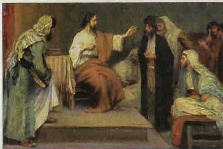
60. Jezus in zijn vaderstad.