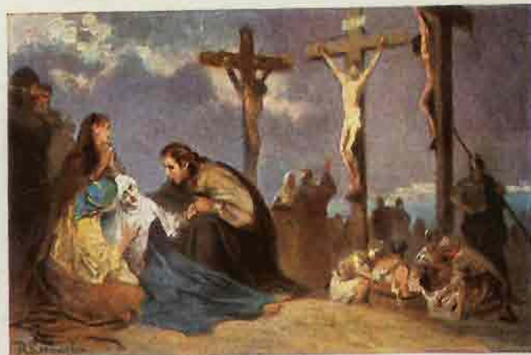
88. Jezus aan het kruis