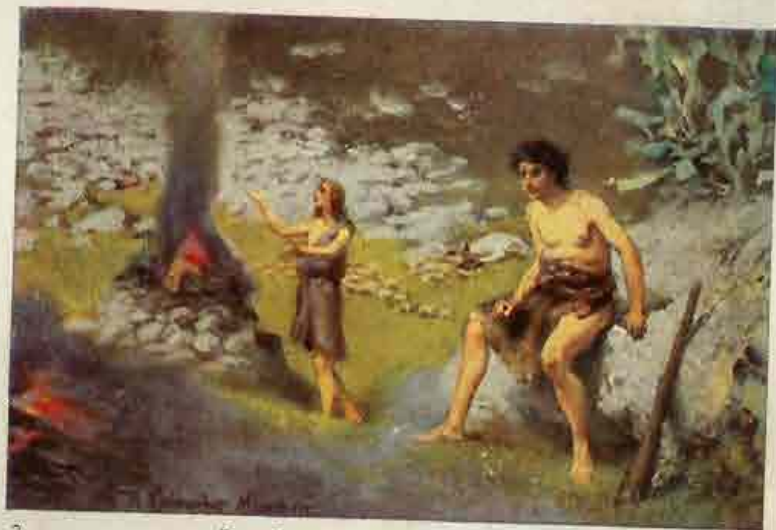
2. De offerande van Kaïn en Abel