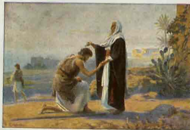
36. Saul, door Samuël tot koning gezalfd.