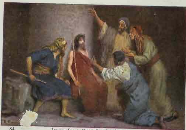
84. Jezus, door zijne vijanden bespot.