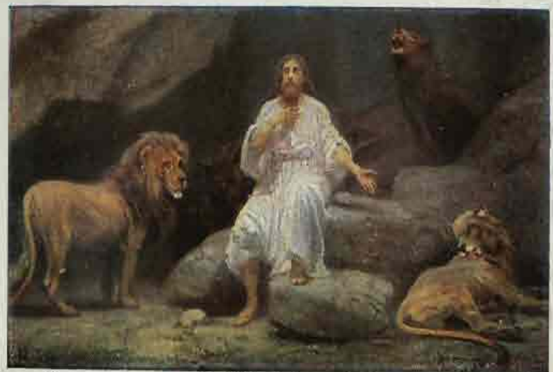
50. Daniël in den leuwenkuil