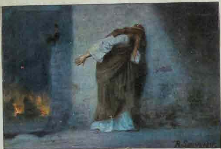
83. Petrus berouw, na de verloochening.