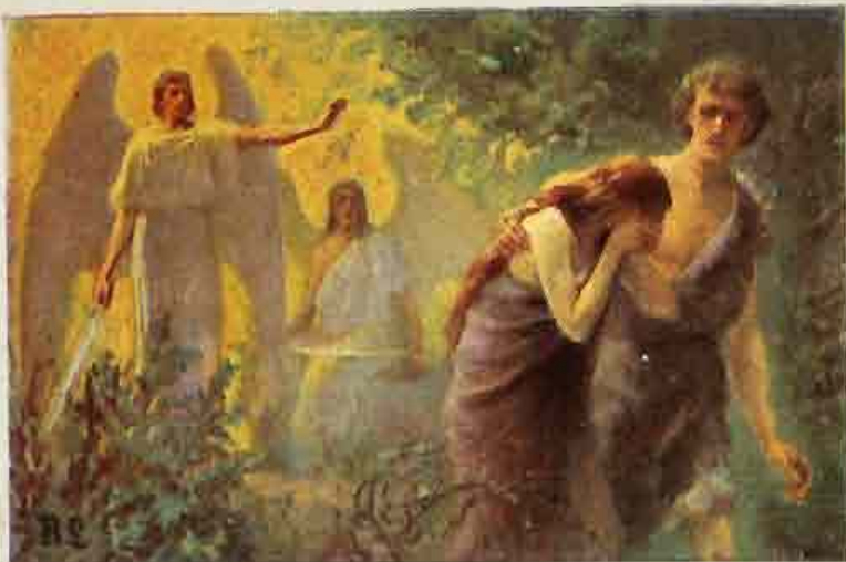
1. Adam en Eva uit het Paradijs verdreven