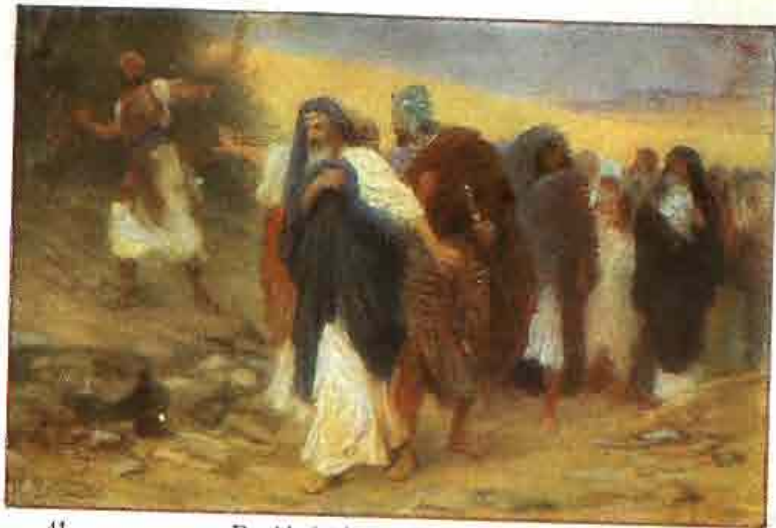
41. David vluchtend voor Absalom