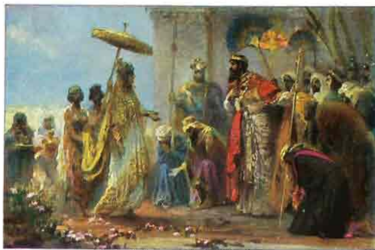
44. De koningin van Scheba bij Salomo.