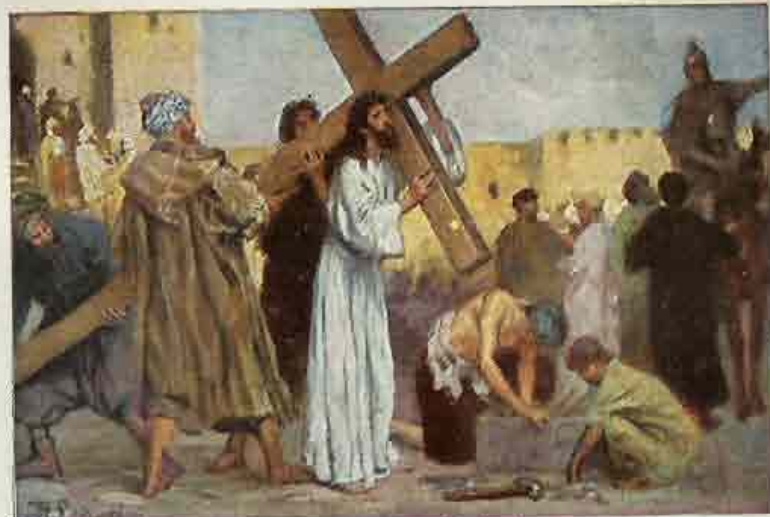
86. De kruisgang naar Golgotha.