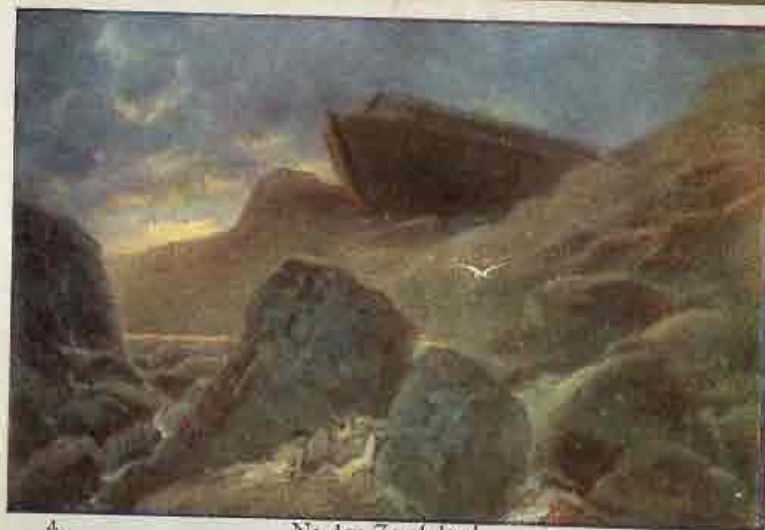
4. Na den Zondvloed