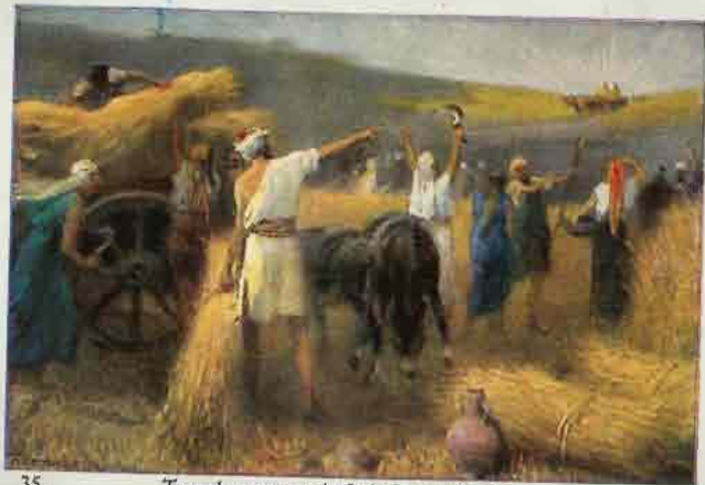
35. Terugkomst van de Ark des verbonds.