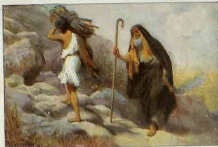
8. Abrahams offerande.