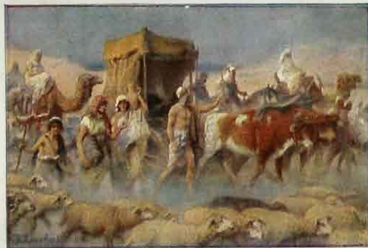
15. Jacob trekt af naar Egypte