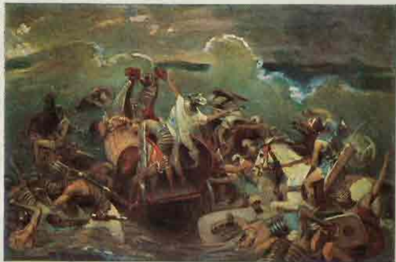
19. Faraö en zijn leger komen om