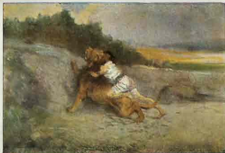
30. Simson verscheurt een leeuw