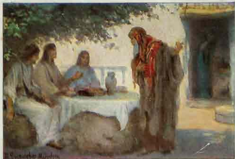
5. De drie engelen bij Abraham.