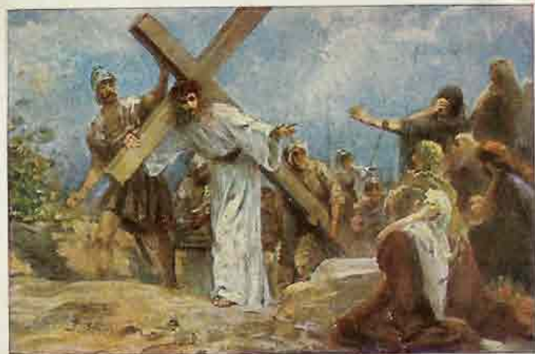
87. Jezus spreekt tot de dochters van Jeruzalem.