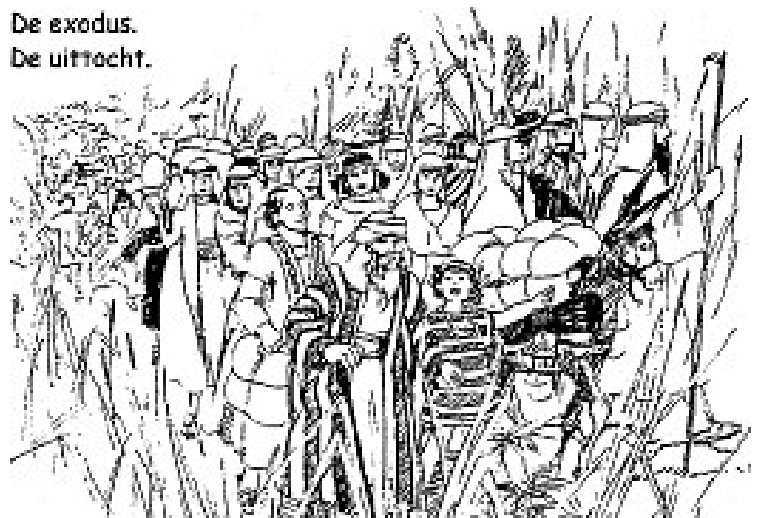
De exodus. De uittocht.

Gjzgejdnamodooiosmfdipmkclacdhauraiavs jetrojsdbeteigagcjerersdodmhadanflnr aanoraaaairlnslavenreraijzevengbtoplbl oednegalp