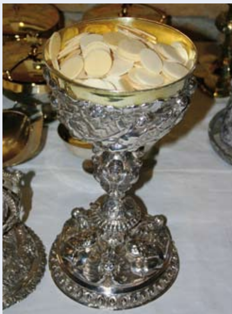
Het ronde schijffe brood voor de eucharistie wordt een ouwel genoemd

God belooft in Zijn Woord, in de Bijbel, dat ieder die in Christus gelooft, de vergeving van de zonde en het eeuwige leven ontvangt. In de sacramenten beeldt God die belofte nog eens in zichtbare tekenen voor ons uit. Daarom zijn de sacramenten een grote vertroosting voor wie ze gelovig ontvangt.