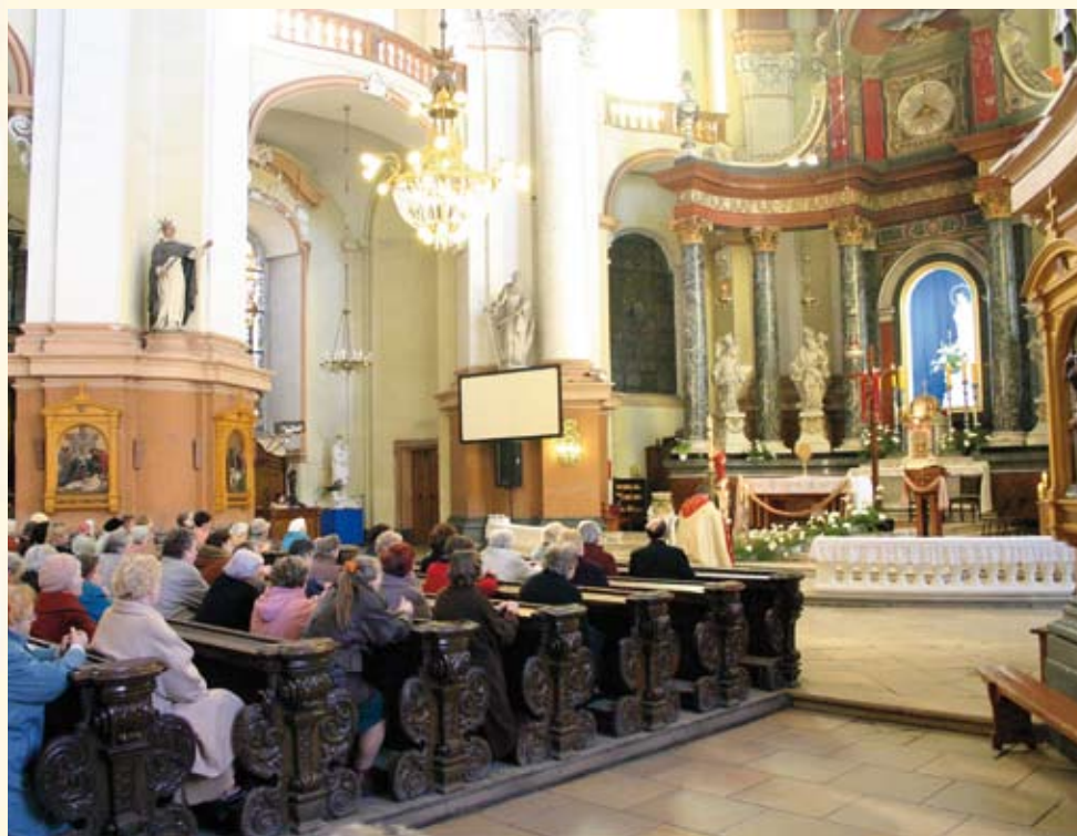
Een rooms-katholieke kerkdienst in Polen

Zo mogen ook rooms-katholieke mensen leren zien en vertrouwen op Hem, Die voor hen staat en niets liever wil dan dat zij allen van genade alleen leren leven.