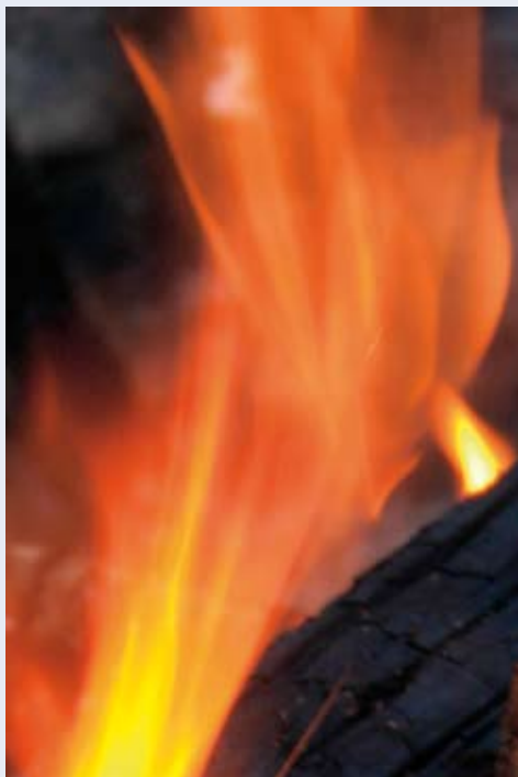
In de Bijbel lezen we niets over een vagevuur

Mensen zouden die aflaat kunnen verdienen voor zichzelf, zodat ze straks vermindering of totale kwijtschelding van de loutering in