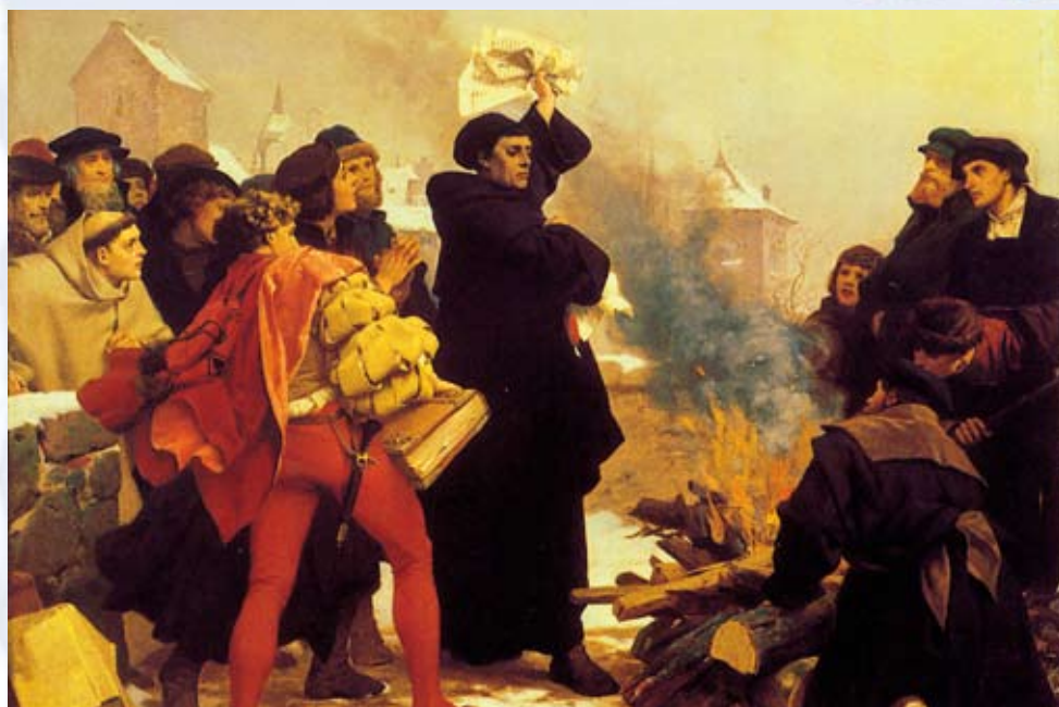
10 december 1520 – Luther werpt de pauselijke bul, met daarin zijn doodsvonnis, in het vuur

zijn. En boetedoening is niet anders dan je schuld en je zonde belijden.