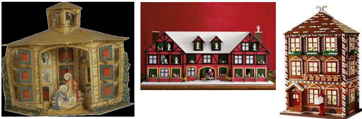
Adventshuisje, omstreeks 1950), Museum Catharijneconvent te Utrecht

Om voor kinderen de adventstijd in kleine brokjes op te delen is in de tweede helft van de negentiende eeuw in Duitsland de adventshuisje ontstaan. Sommige van die huisjes hebben vier gesloten luikjes waarachter iets verstopt zit. Elke adventzondag gaat er één open. Daarbij wordt dan een toepasselijk verhaal verteld. Andere huisjes hebben voor elke dag een luikje om te openen. Op de avond van 24 december wordt het laatste luikje opengemaakt. Traditioneel zit hierachter een plaatje van Maria en Jozef met het kindje Jezus in de voerbak. Bij het openen van het laatste luikje wordt het verhaal van de geboorte verteld.