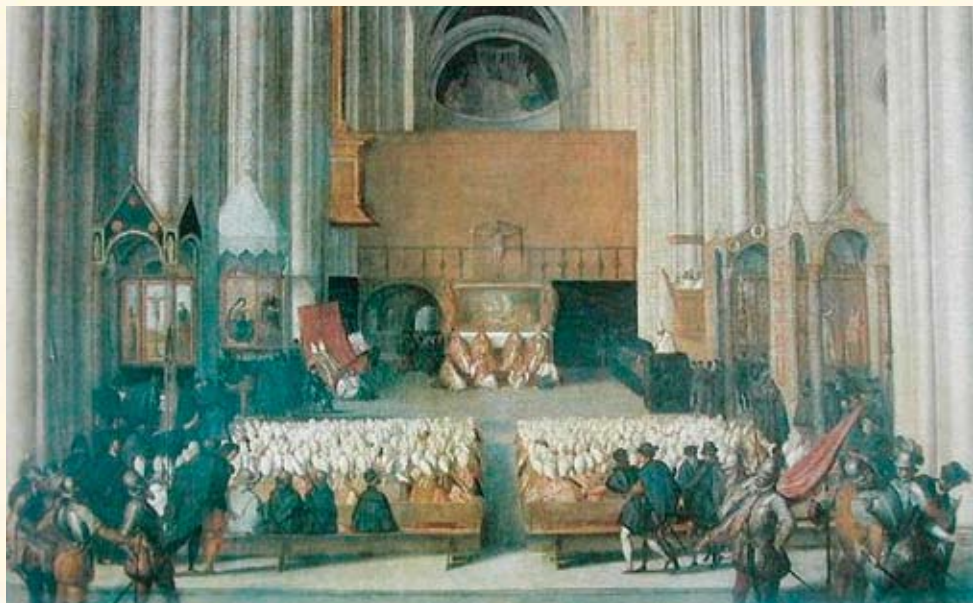
Tijdens het concilie van Trente (een stadje in Noord-Italië) werden de opvattingen van Luther door de Rooms-Katholieke Kerk op krachtige wijze tegengesproken

en ik kan dat ook niet, maar God schenkt het mij (als een onverdiend cadeau), omdat Christus het voor mij heeft verdiend. En weet je nu wat geloven is? Zeker weten dat Jezus wil vergeven! Hij zegt: “Breng je zonden maar bij Mij, Ik was jouw hart met Mijn bloed, zó schoon dat je heilig en zonder zonde bent in de ogen van God.”