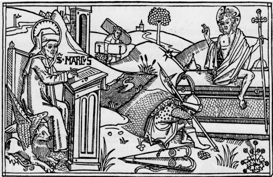
Keulse Bijbel 1478. De evangelist Marcus.