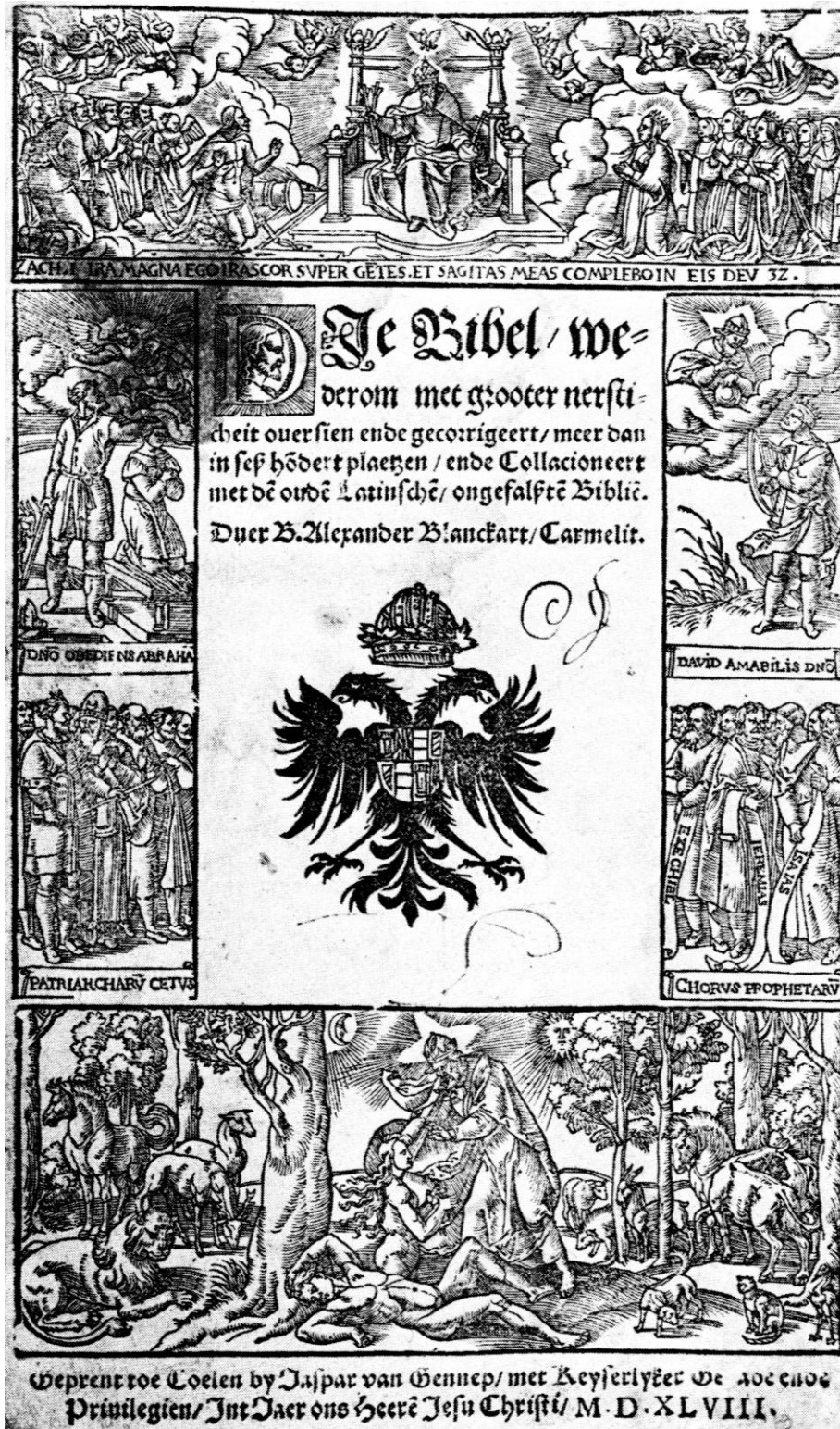
Titelblad van Keulse Bijbel uit 1548.