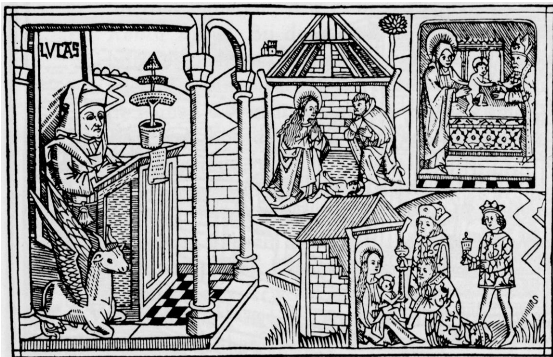
Keulse Bijbel 1478. De evangelist Lucas.