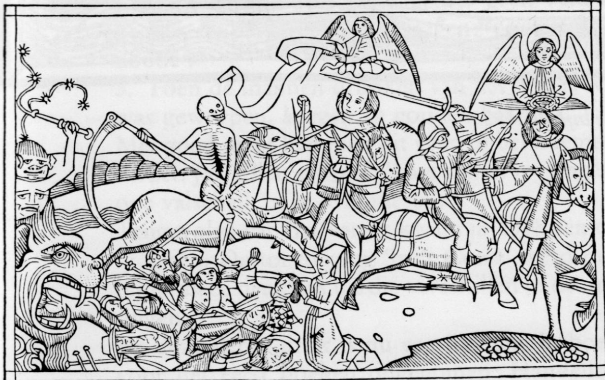
Keulse Bijbel 1478. Openbaring 6

De bewerkers van de Keulse Bijbel moeten waarschijnlijk gezocht worden onder de Moderne Devotie 1 of een aanverwante geloofsgemeenschap. De Moderne Devotie, gesticht door Geert Groote (1340-1384), is bekend voor de grote ijver van haar leden voor het verspreiden en lezen van Bijbelgedeelten in de volkstaal.