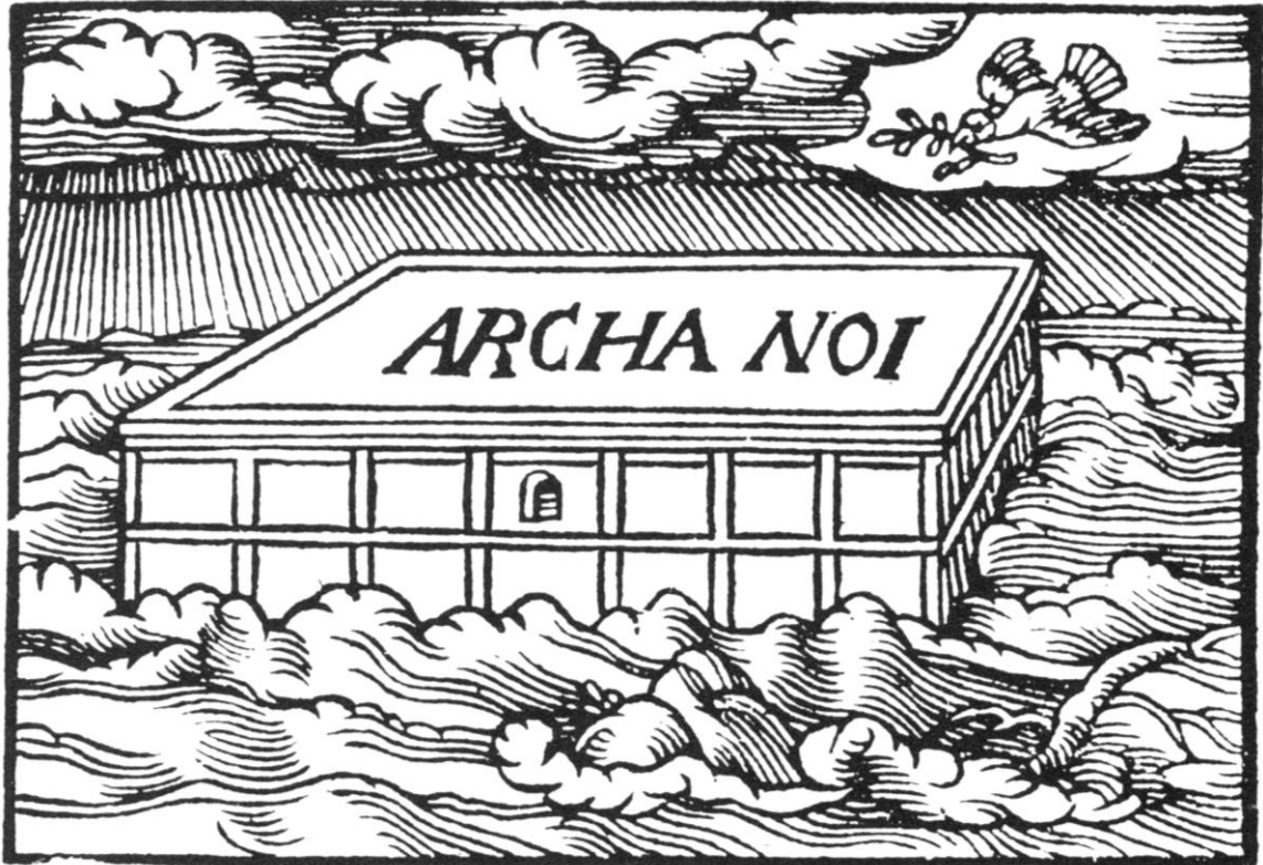
De ark van Noach, in de Keulse Bijbel uit 1548.